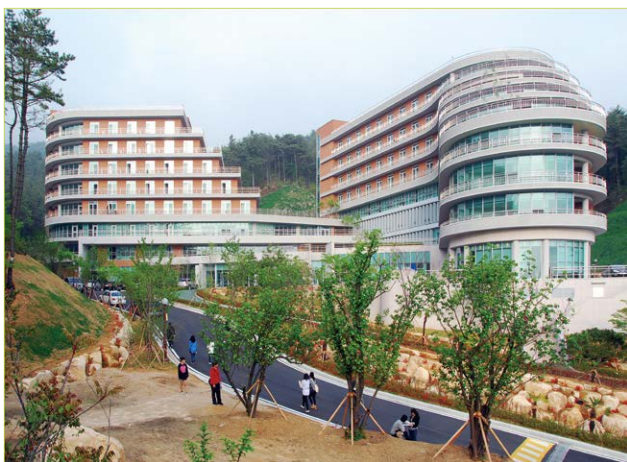
第二宿舍(国际宿舍)