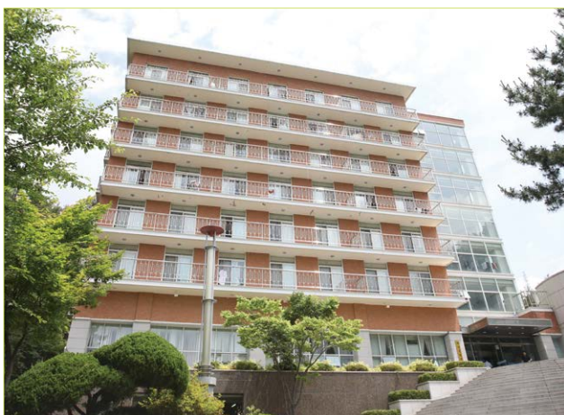
第一宿舍(白杨生活馆)